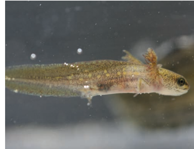
Auf dem Speiseplan steht auch die Larve des Teichmolches

Die erwachsenen Tiere sind auch nicht wählerisch und erbeuten Insektenlarven, Kleinkrebse, Egel, Schnecken, die Nachkommenschaft anderer Molche und was sonst zu finden ist. An Land erjagen sie Regenwürmer, Nacktschnecken, Insekten und mehr. Die Beute wird im Ganzen geschluckt.