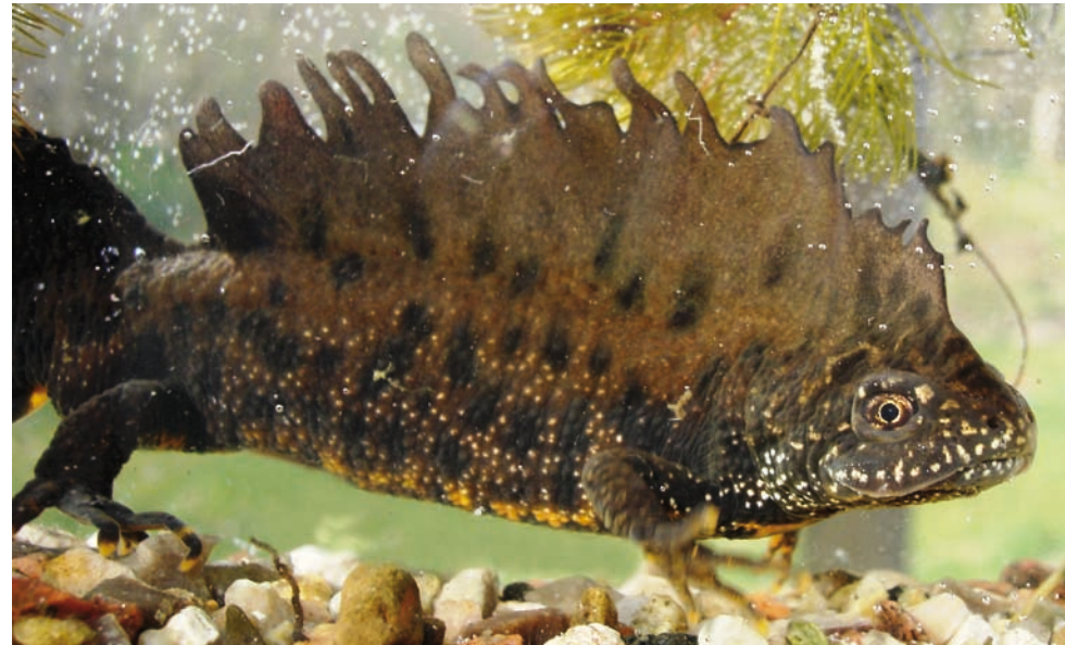
Männchen in Wassertracht

Wer nicht an Drachen glaubt, könnte bei der Begegnung mit dem Kammolch doch Zweifel verspüren, so wird unser größter Molch auch liebevoll „Wasserdrache“ genannt: Die ca. 11-12 cm großen Männchen bilden im Wasser auf dem Rücken einen hohen, stark gezackten Hautsaum, der vom Hinterkopf bis zur Schwanzspitze reicht und nur an der Schwanzwurzel unterbrochen ist. An den Flanken des Schwanzes sieht man einen hellen, weißlichen Streifen. Dieser imposante Körperschmuck, mit dem die Männchen um die meist 12-13 cm großen Weibchen werben, wird nach dem Wasseraufenthalt zurückgebildet.