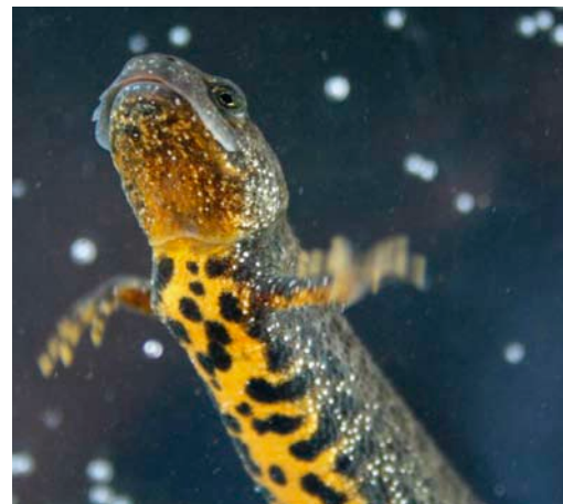
Kammolche haben individuelle Fleckenmuster

Nach dem Einwandern in das Laichgewässer finden Balz und Paarung statt. Die Männchen besetzen Balzplätze, die gegen andere Männchen verteidigt werden und werben um die Weibchen. Das Männchen baut sich direkt vor dem Weibchen auf, macht einen Katzenbuckel und geht dabei fast in einen Handstand über. Auf diese Weise kommt seine imposante Größe, aber auch die Bauchseite mit den prächtigen Farben besonders zur Geltung. Mit seinem Schwanz fächelt er lockende Duftstoffe zu. Geht das Weibchen auf die Werbung ein, so folgt es dem sich fortbewegendem Partner und berührt dessen