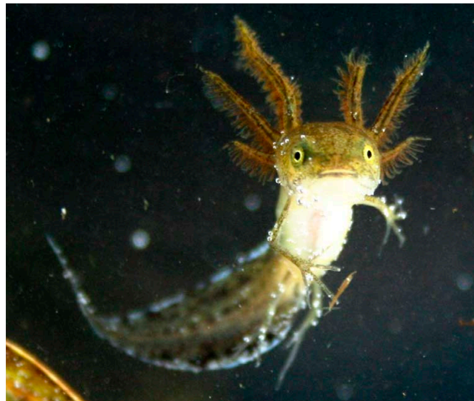
Kammolchnachwuchs: Der Langfinger unter den Molchlarven

Das bizarre Aussehen der Larven könnte auch der Fantasie eines Science-Fiction-Autors entsprungen sein: Auffallende große äußere Kiemenbüschel, die wie eine Wuschel-Frisur aussehen, lange dünne Finger (und später auch Zehen), ein Schwanz mit schwarz und milchigweiß geflecktem Flossensaum, der in einem Faden endet, große Augen und ein Schmolmund.