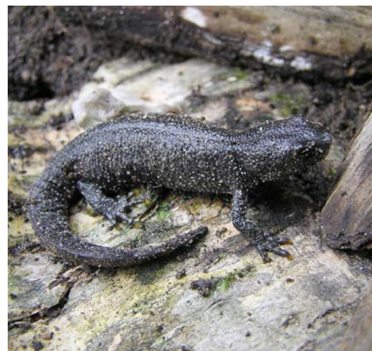
In der Landphase führen die Kammolche ein verstecktes Leben

Zum weiteren charakteristischen Aussehen gehört bei beiden Geschlechtern eine an Rücken und Seiten leicht warzig gekörnte Haut. Die Flanken sind weißlich granuliert. Im Normalfall ist die Oberseite der Tiere unauffällig braun-schwarz gefärbt, der Bauch dagegen hellgelb bis rot-orange mit schwarzen Flecken. Mit diesem individuell unterschiedlichen Fleckenmuster kann man einzelne Tiere bei feldbiologischen Untersuchungen unterscheiden.